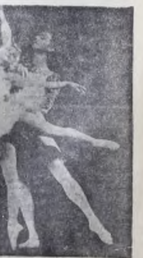
Большой театр. «Шелкунчик»