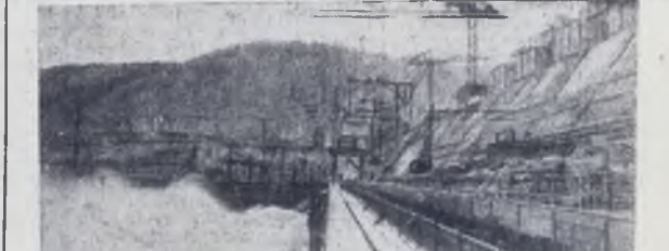
Двнвогорск. Панорама строительства Красноярской ГЭС с нижнего бьефа.

На снимке: идет монтаж.