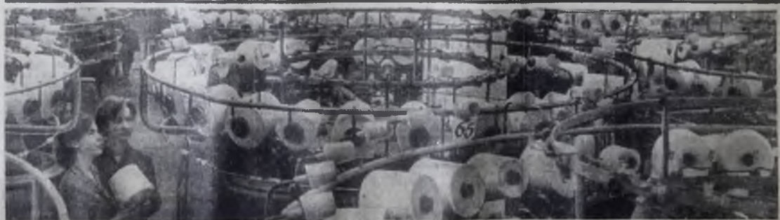
В плавильном цехе Таллинской трикотажной фабрики «Марат».

И. ГАБРУСЕНКО, работники отдела кадров треста Востокхиммонтаж.