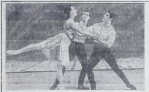
Башкирский государственный театр оперы и балета показал премьеру нового балета башкирского композитора Наримана Сабитова «Люблю тебя, жизнь». Тема балета — любовь к Родине, верность. Премьеру тепло встретили зрители.