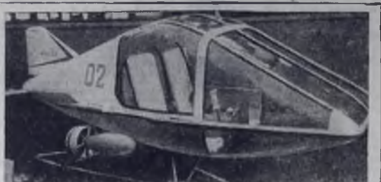
МОСКВА. Эта двухместная подводная лодка «МАИ-3» — экспонат Выставок достижений народного хозяйства СССР. Лодка, сконструированная и построенная в студенческом конструкторском бюро Московского аэрокосмического института имени Серго Орджоникидзе, предназначена для научно-исследовательских работ. Она может быть также использована и любителями подводного спорта. Глубина погружения — 50 метров, скорость под водой 7 километров в час. Нынешним летом она успешно прошла морские испытания.