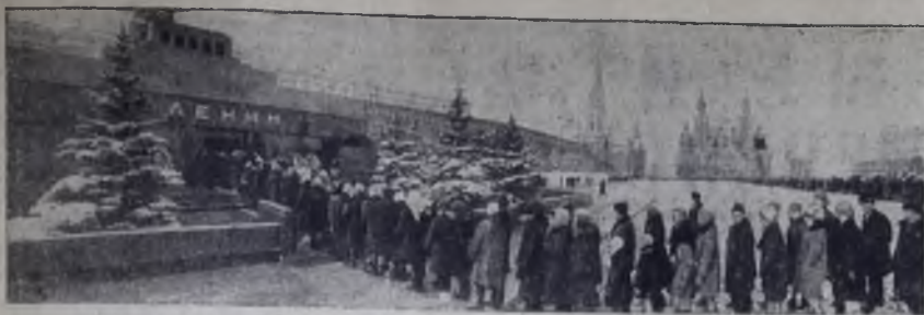
Москва, январь 1968 года. Нескончаемый живой поток движется по Красной площади... Ежедневно тысячи людей — москвичей, приезжих из разных районов нашей страны и зарубежных гостей — приходят сюда, к Мавзолею В. И. Ленина, чтобы почтить память великого вождя, основателя первого в мире социалистического государства.