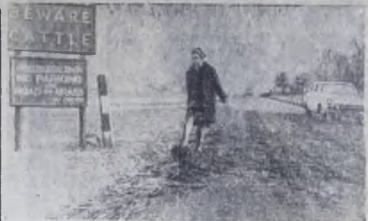
В Англии на некоторых дорогах разостлали соломенные покрытия, пропитанные дезинфицирующими средствами. Соломенные барьеры — один из способов предупреждения распространения вируса. По сообщению агентства АР, уже забито почти 160 тысяч животных. На снимке — падежь в графстве Девоншир. Плакат гласит: «Осторожно — скот!». Запрещена стоянка автомашин на дороге и на обочине. Телефон АР — ТАСС.

НЬЮ-ПОРК. Гарри ФРИМЕНТ, корреспондент ТАСС.