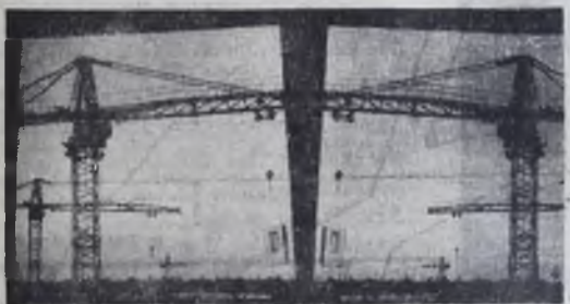
КРАНЫ В ЗЕРКАЛЕ