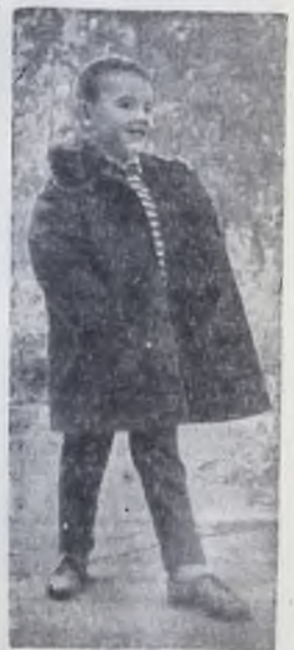
ХАРЬКОВ. 72 тысячи изделий только лишь в прошлом году вложено в оборот, будет вложено в оборот в предстоящем объединенном в июльском году. Это мужские, женские, детские пальто и куртки самых современных фасонов, всевозможные шапочки и др.

На мальчине пальто из ватной овчины, покрытой водоотталкивающей тканью.