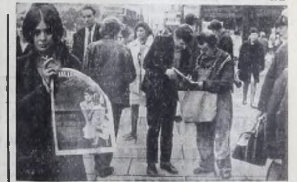
ВЕЛИКОБРИТАНИЯ. По всей стране ширится движение протеста против тайной войны, вазализации США во Вьетнаме. Английская молодежь принимает активное участие в борьбе за прекращение преступной агрессии. На улицах Лондона, Глазго, Ливерпуля и других городов можно встретить молодых англичан, собиравшихся под лозунгами к выводу американских войск из Вьетнама. На снимке: сбор подписей на улицах Эдинбурга.