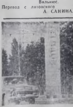
Въезд в Ангарск.

Янина ДЕГУТИТЕ. Вильнюс. Перевод с литовского А. САНИНА.