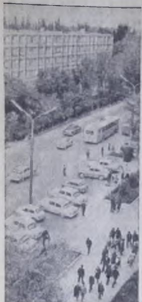
ФРУНЗЕ. Главная магистраль города — улица имени ХИИ партсъезда.

ПО ИТОГАМ Всесоюзного смотра научно-технических библиотек страны Министерством нефтеперерабатывающей и нефтехимической промышленности присудило первое место. Почетную грамоту и денежную премию научно-технической библиотеке ангарского нефтехимического комбината.