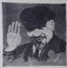
В ПРЕЗИДИУМЕ ВЕРХОВНОГО СОВЕТА СССР

За активное участие в Великой Октябрьской социалистической революции, гражданской войне и в борьбе за установление Советской власти в 1917—1922 годах, в связи с 50-летием Великого Октября Президиум Верховного Совета СССР Указом от 28 октября 1967 года награждал орденами и медалями СССР большую группу активных участников в Великой Октябрьской социалистической революции, старых большевиков, бывших красногвардейцев, бойцов и командиров Красной Армии и Флота, красных партизан, работников партийных, советских, профсоюзных и комсомольских организаций, ревкомов, ВЧК и милиции, бойцов ЧОН, продотрядов и других лиц, наиболее отличившихся в борьбе за установление Советской власти в 1917—1922 годах, проживающих в РСФСР. В том числе в Ангарске: