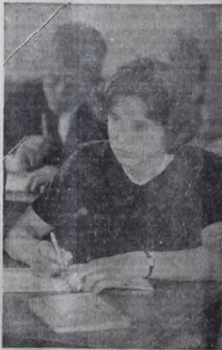
За партой.

В строй вступила вторая очередь крупнейшего в Средней Азии высокоавтоматизированного мельничного комбината. За сутки здесь будут перерабатывать 245 тонн зерна. Выпущена первая продукция — пшеничная мука высшего и первого сортов.