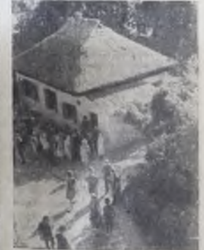
Каждый, кто побывал в Патристическом непереносимом месте. Одна из драгоценнейших реликвий России «Домик Лермонтова». Здесь поэт проводил последние дни жизни, сюда же привезли его бедняцкое тело после дуэли. На снимке: так выглядит теперь «Домик Лермонтова».