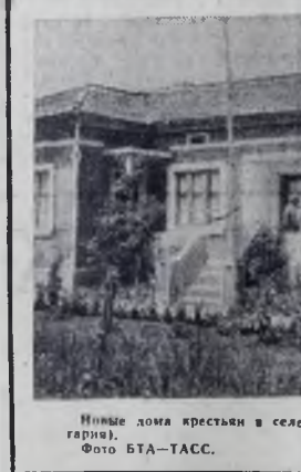
Нинье дома крестьян в селе Божурово Толбухинского округа (Болгария).

Румыния. На складе готовой продукции нового швейцарско-румынского комбината в городе Дея Кужужской области. Годовая мощность предприятия — 60 тысяч тонн пеллолозы высшего качества и 35 тысяч тонн упаковочной бумаги.