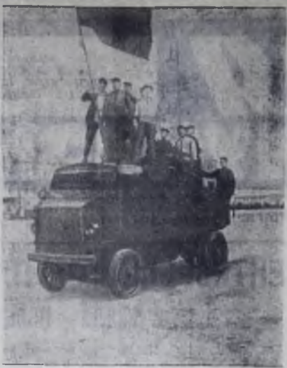
Красногвардейцы на Красной площади в Москве. 1917 год.