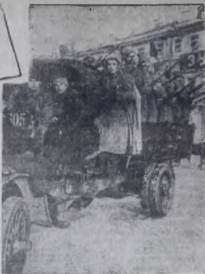
Петроград. 1917 год. Отряд революционных солдат.

Между 12 и 14 сентября В. И. Ленин пишет