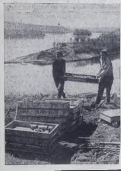
Толстый мыс на Ангаре. На вершине его бурячишки бурят пробы скальной породы. Толстый мыс подставит свое плечо плотине Усть-Илимской ГЭС — третьей гидроэлектростанции Ангарского каскада. К юбилею Октября строители спешат завершить подготовку котлована первой очереди для гидростанции.

Коллектив мастерской изготавливает лестничные ограждения, различные за-