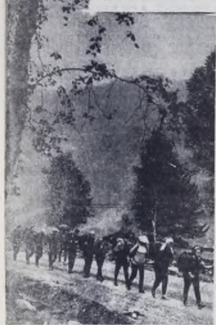
Мы вышли в поход