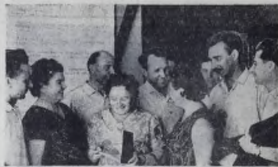
На III сессии городского Совета депутатов трудящихся. В перерыве между заседаниями.

Сессия приняла решение, в котором нашли отражение недостатки в работе по подготовке к переходу на пятидневную рабочую неделю и меры по их устранению.