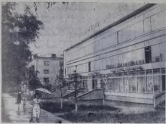
Новый Дом быта «Прогресс» открылся в Краматорске. К услугам посетителей — музыкальный салон, ателье мод, ремонтные мастерские.