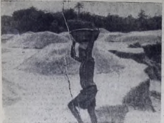
Африканская страна Сьерра-Леоне расположена на западном побережье Атлантического океана. На этой земле имеются большие запасы алмазов. Для их добычи построены богатейшие фабрики, которые принадлежат англичанам. Наряду с промышленной добычей алмазов существует и старательский метод. Старателей особенно много на реке Сэва, когда она сильно мелеет. Им приходится трудиться в очень сложных условиях, перетаскивая на руках ежедневно по несколько тонн песка.