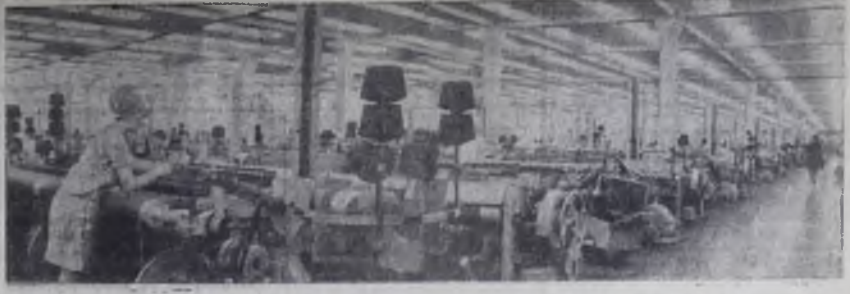
Иваново. Ткацкий цех камвольного комбината.

Я ПРИМОСТИЛАСЬ на ящике сигнальных флагов и, облокотясь на опущенное стекло иллюминатора, смотрю в даль. Вода за бортом, как в блюде. Не шлохнется. Она напоминает кожу кита — такая же черная и гладкая. А кита мы видели вчера на гидрографическом судне. Не знаю, как его поймали, но висел он очень смиренно, вздернутый за хвост ледяной. Хотя это, наверно, был не кит, а китенок, и, может, в этой черноте остался его мам... Хорошо думается, когда взгляды просторно, и тишина звенит.