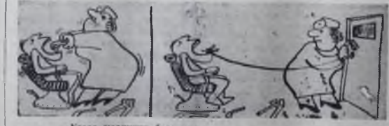
Когда медицина бессильна...