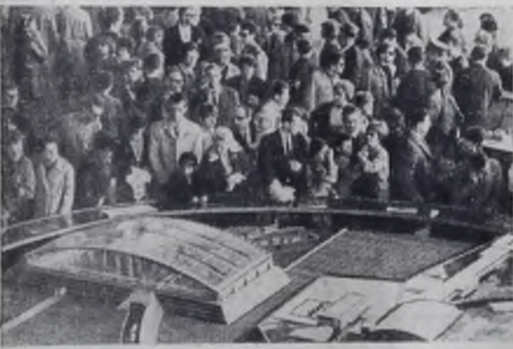
Советский павильон — в центре внимания многочисленных туристов, прибывших в канадский город Монреаль на Всемирную выставку «ЭКСПО-67».

министр Ховейда подчеркнул важность проведения Ираном независимого внешнеполитического курса.