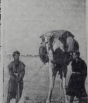
А.Л.ЖИР. Кочевники в районе Тиндиф на западе пустыни Сахара.