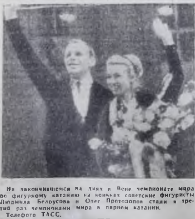
На закончившемся яхт на Вене чемпионате мира по фигурному катанию на коньках советские фигуристы Людмила Белоусова и Олег Протопопов стали в третий раз чемпионами мира в парном катании.

Георгий ЯФФЕ, капитан дальнего плавания. (ЛПН).