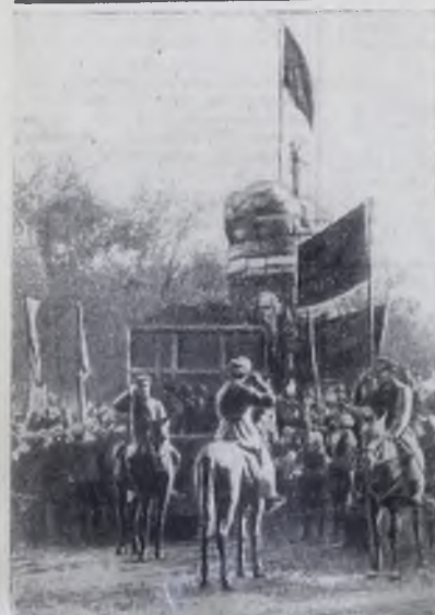
Поднятие Красного знамени в честь провоз- гашения Советской власти в Ташкенте.

Ее текст гласил: «Приветствуя новое революционное прави- гельство, выдвинутое по- бедоносным восстанием пролетариата и гарнизо- на столицы против контр- ре- волюционной буржуа- Организовать Советс- лии, правительство рабо- кую власть в г. Иркут- чих, солдат и крестьян, ске, отстранив агентов как истинного выразите- Временного правительст- ля великой Российской на Керенского и подпи- революции и защитника нив Советской власти интересов пролетариата и все местные правительст- всей революционной де- венные учреждения».