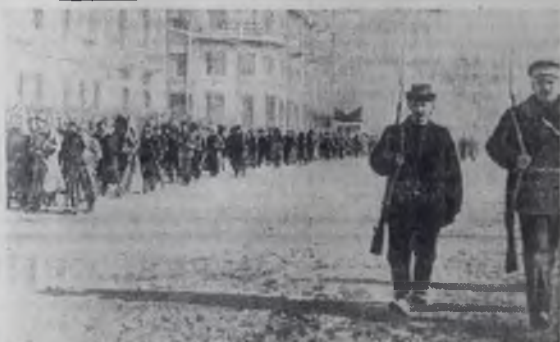
Чита. 1917 год. Красная гвардия.

Почти полвека прошло с той поры, когда Ленин, выступая 25 октября (7 ноября) 1917 года с докладом о задачах власти Советов на заседании Петроградского Совета, сказал: «Отныне наступает новая полоса в истории России, и данная, третья русская революция должна в своем конечном итоге принести к победе социализма». Пророческие слова великого вождя революции сбылись. Завершив построение социализма, советский народ, руководимый партией Ленина, возводит сейчас светлое здание коммунизма.