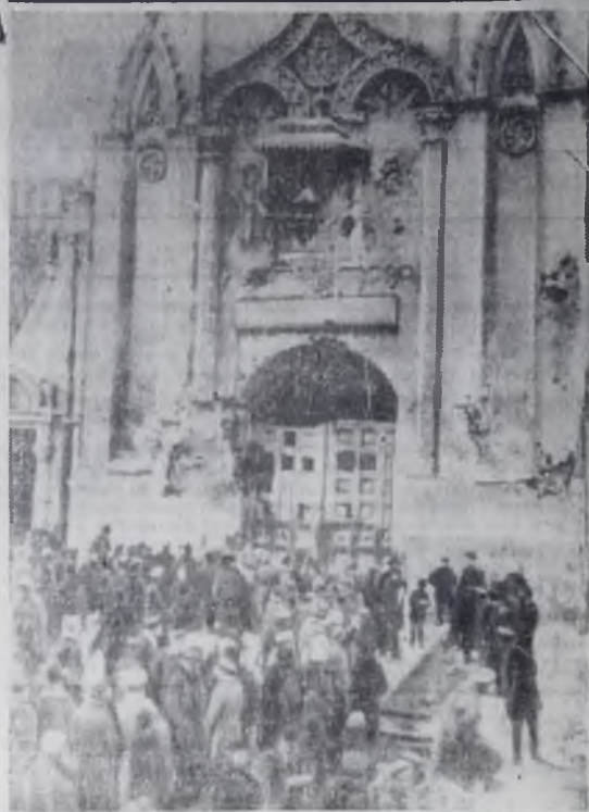
Ноябрь 1917 года. Кремль взят. У Никольских ворот.

Вслед за Петроградом и Москвой красные знамена революции взметнулись над Минском, Владимиром, Иваново-Вознесенском, Луганском, Орехово-Зуевым, Казанью, Уфой, Рязанью, Екатеринбург, Самарой, Саратовом, Ярославлем, Нижне-Новгородом... Подобно горному потоку, революция неслась по громадной территории бывшей Российской империи, сметая навсегда господство эксплуататоров. С октября 1917 по январь - февраль 1918 года она распространилась по всей стране. Это был, по определению В. И. Ленина, «триумфальный марш Советской власти».