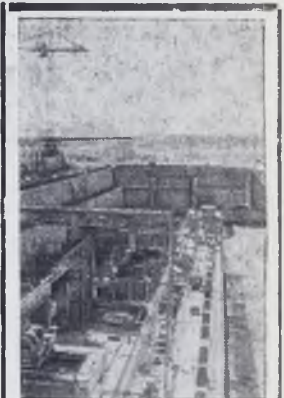
ОБЪЕДИНЕННАЯ АРАБСКАЯ РЕСПУБЛИКА. Сопутствие гигантской плотины в Асуане осуществляется с помощью Советского Союза — доведение производственной мощности гиганта польской промышленности до 5,5 миллиона тонн стали в год. Сейчас комбинат производит в 2,5 раза больше стали, чем все металлургические заводы до войны, и дает народному хозяйству около половины всей продукции страны в этой отрасли экономики.

Получены первые тонны продукта на ксилолах и фталевом ангидриде, выходят на режим установки каталитического крекинга и предварительной очистки сырья для каталитического платформинга.