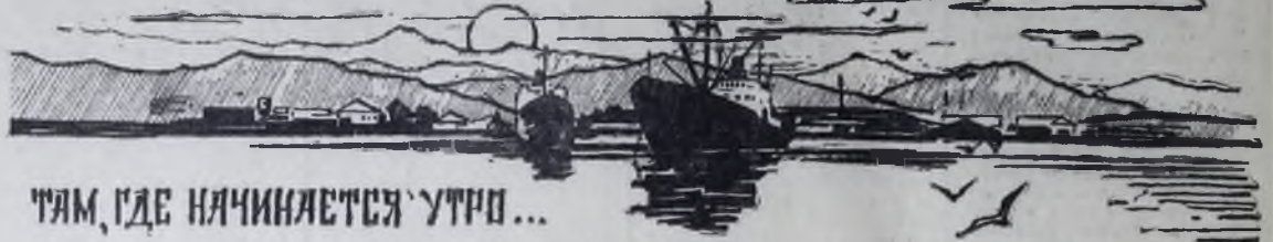
ТЯМ, ГДЕ НАЧИНАЕТСЯ УТРО...

СЕНТЯБРЬ. В уютных каютах теплохода «Туркмения» разместились представители 42 городов страны — люди самых различных возрастов и профессий из неунывающего и беспокойного племени туристов. Два дня мы провели во Владивостоке, знакомясь с его достопримечательностями. А потом «Туркмения» дала прощальный гудок и взяла курс на Север, к бухте Олга. В ней мы пробыли день, совершив интересную экскурсию по шлопкам вдоль живописных берегов, а затем — пеший поход к Синим скалам. Погода отличная. Теперь идем к Тетюхе, в переводе на русский — «Долине кабанов». Тетюхе — кладовая несметных богатств, наглядное представление о которых получаешь в геологическом музее. Все чрезвычайно интересно, но посещение Николаевской пещеры оставляет неизгладимое впечатление. Подымаемся к входу по узкой лестнице в скалистом склоне сопки. Он метрах в 50 от основания. В руках у нас свечи.