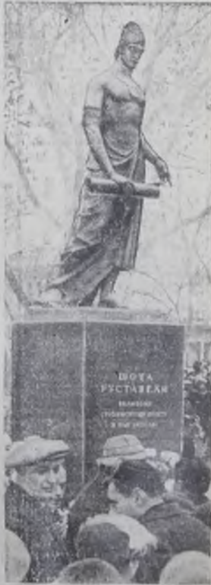
В Москве открыт памятник петлюмовому грузинскому поэту и мыслителю Шота Руставели.

Многие прошли школу Караваева, школу, которая помогла им стать волевыми, мужественными и честными людьми. В. КУРЬЯНИНОВ.