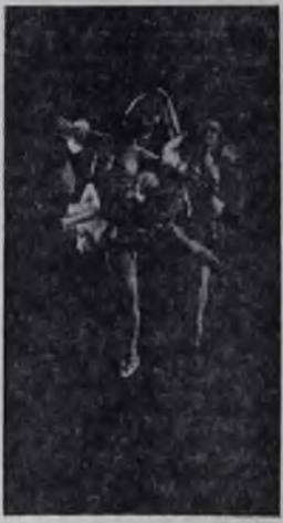
На сцене Дворца культуры «Нефтяник».