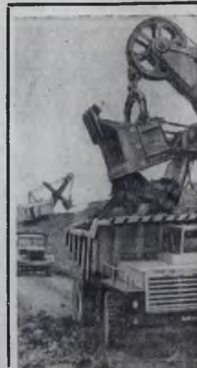
САХАЛИН. Уголь, добываемый открытым способом в Лермонтовском шахтоуправлении, по своей себестоимости самый экономичный на острове.

Квартирная плата в СССР является самой низкой в мире. Советские люди оплачивают лишь треть расходов на содержание жилья, остальные две трети — государство. На оплату жилой площади и коммунальных услуг