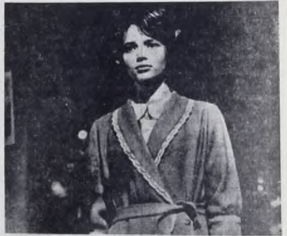
На снимке: кадр из фильма «Им было 18 лет».

Да, наука, прежде всего — труд, беспримесный, настоящий, самоотвер-