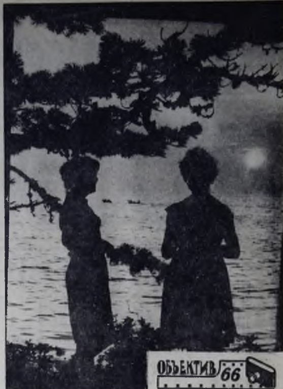
НА БЕРЕГУ БАНКАЛА

ХРОНИКА ФУТБОЛА Результаты игр за 2 и 3 июля: Осака — Цесимити — 3:1. Рыбак — Торпедо — 0:0. Забайкалец — Прогресс — 1:2. Шахтер (П) — Шахтер (К) — 1:0. Авангард — Иртыш — 3:0.