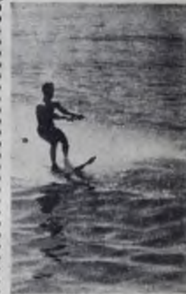
Навстречу брызгам.