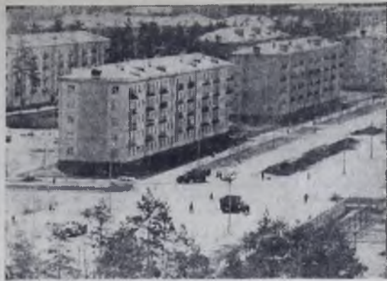
Как растут города? Приходят романтики в тайгу, ставят палатки, корчуют тысячи кубометров корней, поднимают на дыбы горы земли... И вот уже — через года — тайга распахнула свои просторы, и выше сосен и берез вырастают жилые кварталы.