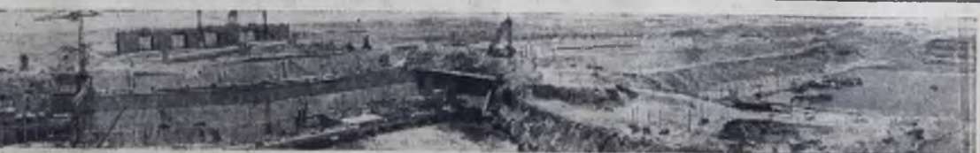
Объединенная Арабская Республика. Общий вид строительства высотной Асуанской плотины.