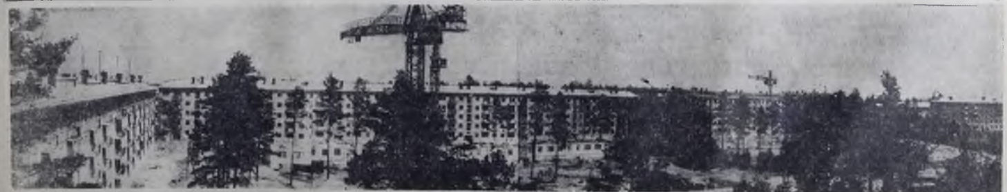
Вот как разросся новый жилой массив 84-го квартала. Во многих домах уже ведут отделочные работы. Очень скоро в них въедут первые новоселы.

ствующего дефицита министр финансов предложил повысить налог на мыло, спички, минеральную воду, бензин. На 20 процентов повышется налог на импортные изделия: автомашины, радиоприемники, телевизоры.