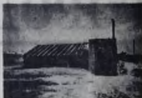
Так начинался Ангарск в 1947 году.