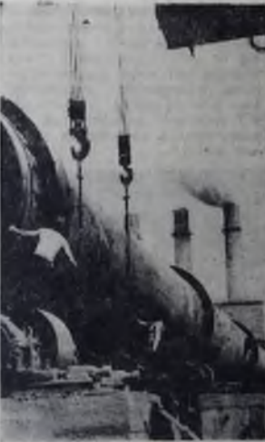
Ангарский цементный завод, 1959 год.