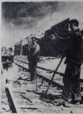
Проспект им. Карла Маркса, 1960 год.