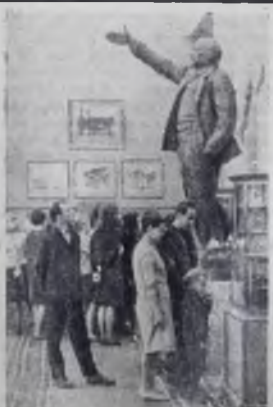
На снимках: справа — Центральный музей В. И. Ленина. Слева — в одном из залов музея.

Экспозиция музея все время пополняется новыми материалами, связанными с жизнью и деятельностью В. И. Ленина. За 30 лет в музее побывало около 27 миллионов человек. Только в 1965 году в музее побывало свыше 1.500 тысяч посетителей. Из них около 25 тысяч иностранных гостей и туристов.