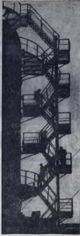
«СИЛУЭТ XX ВЕКА». ОБЪЕКТИВ 66

Честно сказать, сказать, знаешь Коммунистиче... с победою... бывает и счастье И. Я. Френкель