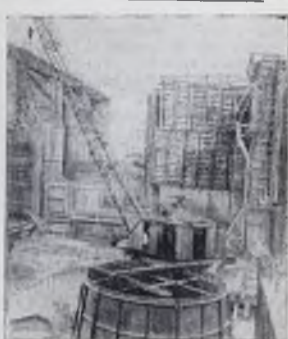
Демократическая Республика Вьетнам. В провинции Иенбай близ поселка Тхань-Ба с помощью Советского Союза сооружается гидроэлектростанция мощностью свыше 100 тысяч киловатт. Уже завершен большой цикл работ. На стройке вместе с вьетнамскими рабочими и инженерами трудятся советские специалисты. С введением в строй ГЭС будет создаваться электроэнергией десяти крупнейших предприятий. Образованная искусственное озеро позволит орошать земли кооперативов и госхозов. На снимке: на одном из участков строительства.