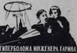
ГИПЕРБОЛОИД ИНЖЕНЕРА ГАРИНА

стой мечтал о постановке фильма по своему роману и даже начал работать над сценарием. Но довести работу до конца ему не удалось. К сожалению, следы сценария, принадлежавшего Толстому, до сих пор не обнаружены.