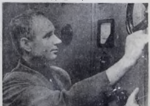
С 1954 года Федор Дейнска «лежит» установки тока высокой частоты. Его профессия — наладчик ТВЧ. И нет такой неисправности в термическом цехе, которую бы быстро не устранил опытный наладчик. Он ударник коммунистического труда. Товарищи избрали его председателем цехового комитета.

И. ХОХРИН, председатель Ангарского горплана.