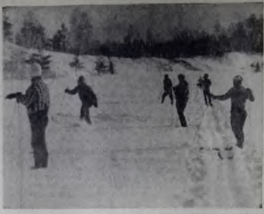
СНЕГА ПОСЛЕДНИЕ.

мажные пакеты фасуется такое же, как и в стеклянную посуду, и сроки хранения одинаковые, согласно ГОСТу: в прохладном месте при плюс восьми градусах Цельсия не более 20 часов.