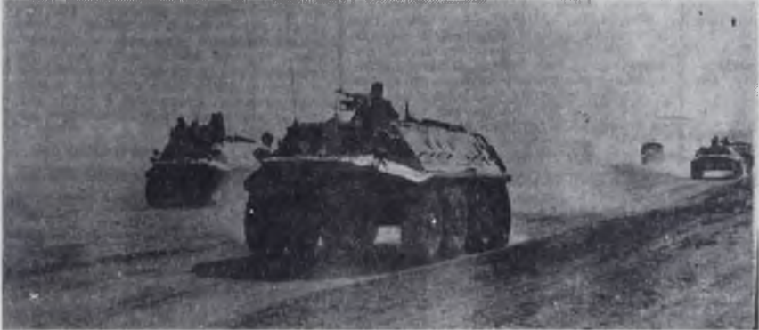
Мотопехота на марше. Идут бронетранспортеры.

А почему бы не написать такие письма и многим другим — инструкторам, секретарям партийным, комсомольским — да подарить письмо этим дома, узнать, как живут солдатыские матери и жены, а если надо, то и помочь в нужде какой. Насколько бы легче служилось, получи солдат такое письмо. Глядишь, и прибавилось у него пятерок за боевую выучку, а значит — крепче и оброну Родины. А что может быть выше этой цели? (Окончание в следующем номере)