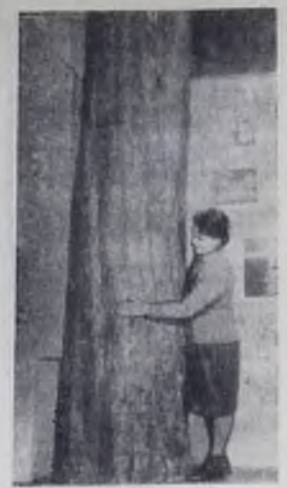
В Хабаровском краеведческом музее появился новый экспонат. Его доставили в музей экспедиция, возглавляемая краеведом В. П. Сысоевым. В глубокой тайге на берегах горной реки Долги (приток Хоры) участники экспедиции нашли хвойное дерево — тисс острокипячий, недоступный раньше усурейским лесов, живая памятник глубокой древности. Дерево простояло на берегу реки, как определили специалисты, более 1400 лет. В музее тисс выглядит так, будто он и не менял «аромата». Правда, пришлось опилить вершину, иначе богатырь не поместился бы в музей. Высота дерева — почти 14 метров, диаметр ствола у корня — около метра.

НА СНИМКЕ: тисс-богатырь.