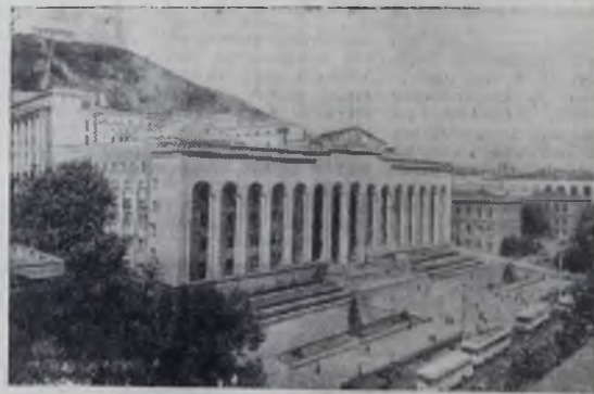
ТБИЛИСИ. Дом правительства Грузинской ССР.