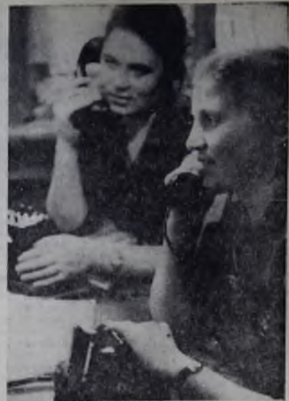
Вам приходилось звонить по телефону 09 в справочное бюро Ангарска? Здесь вы можете получить точный номер абонента. Ангарская телефонная станция носит высокое звание коммунистической.