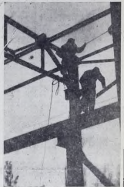
«К небу».

Предприятие поддержало и почин по экономии материалов. По предварительным подсчетам, Сибтеплоизоляция сможет сэкономить 280 кубометров минеральной ваты, 170 кубометров скорлупы и 5 тонн металла. Рационализаторы предприятия обязались сэкономить за счет внедрения технических новинок и приспособлений 40 тысяч рублей.