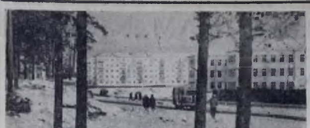
ГОРОД МОЙ. ГОРОД...