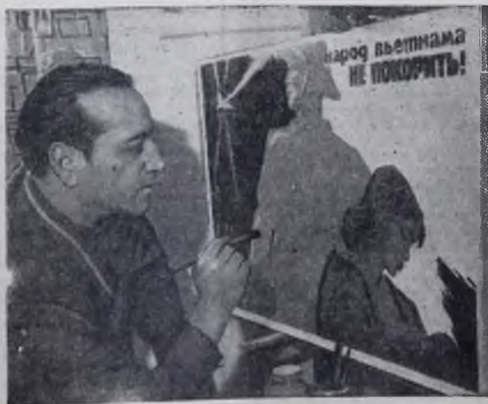
ПЕРОМ И КИСТЬЮ

НАРОДЫ МИРА КЛЕЙМЯТ ПОЗОРОМ АМЕРИКАНСКИХ ИНТЕРВЕНТОВ!