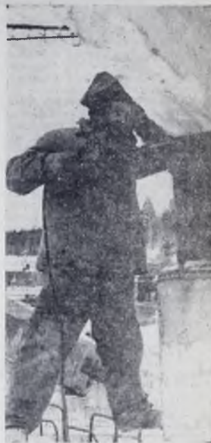
Хозяин голубого огня.