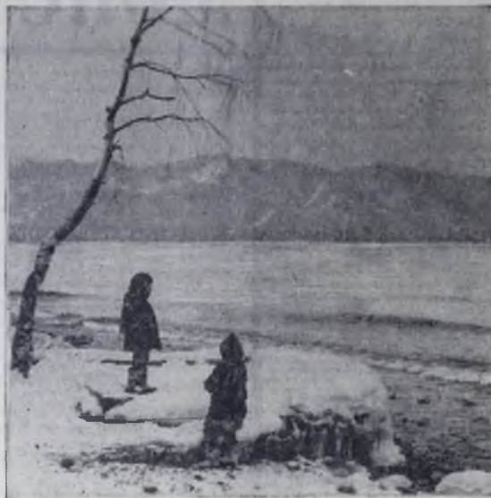
На берегу Байкала.