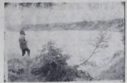
Поиски и приключения

НАША планета бережет еще множество загадок в недрах своих, в океанских пучинах и на поверхности. Наука в последние годы дарит нас фактами, открытиями, которые могут привести в уныние даже писателем-фантастом.