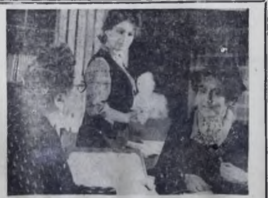
У этого спектакля есть и горячие поклонники, и ярые противники. О нем много говорят в споры. Если вы, читатель, уже посмотрели «Гусиный перо» в исполнении артистов Ангарского Народного театра, напишите нам, в редакцию свое мнение о постановке, об игре актеров. Фото сценки из «Гусиного пера».

Сегодня, в 12 часов, книжный магазин «Аэлита» проводит встречу ветеранов Великой Отечественной войны с книголюбями города. Ветераны расскажут о незабываемых днях войны, вспомнят однополчан. А потом встанут за прилавком продавать книги о Великой Отечественной.