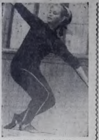
НА ПУТИ К МАСТЕРСТВУ.