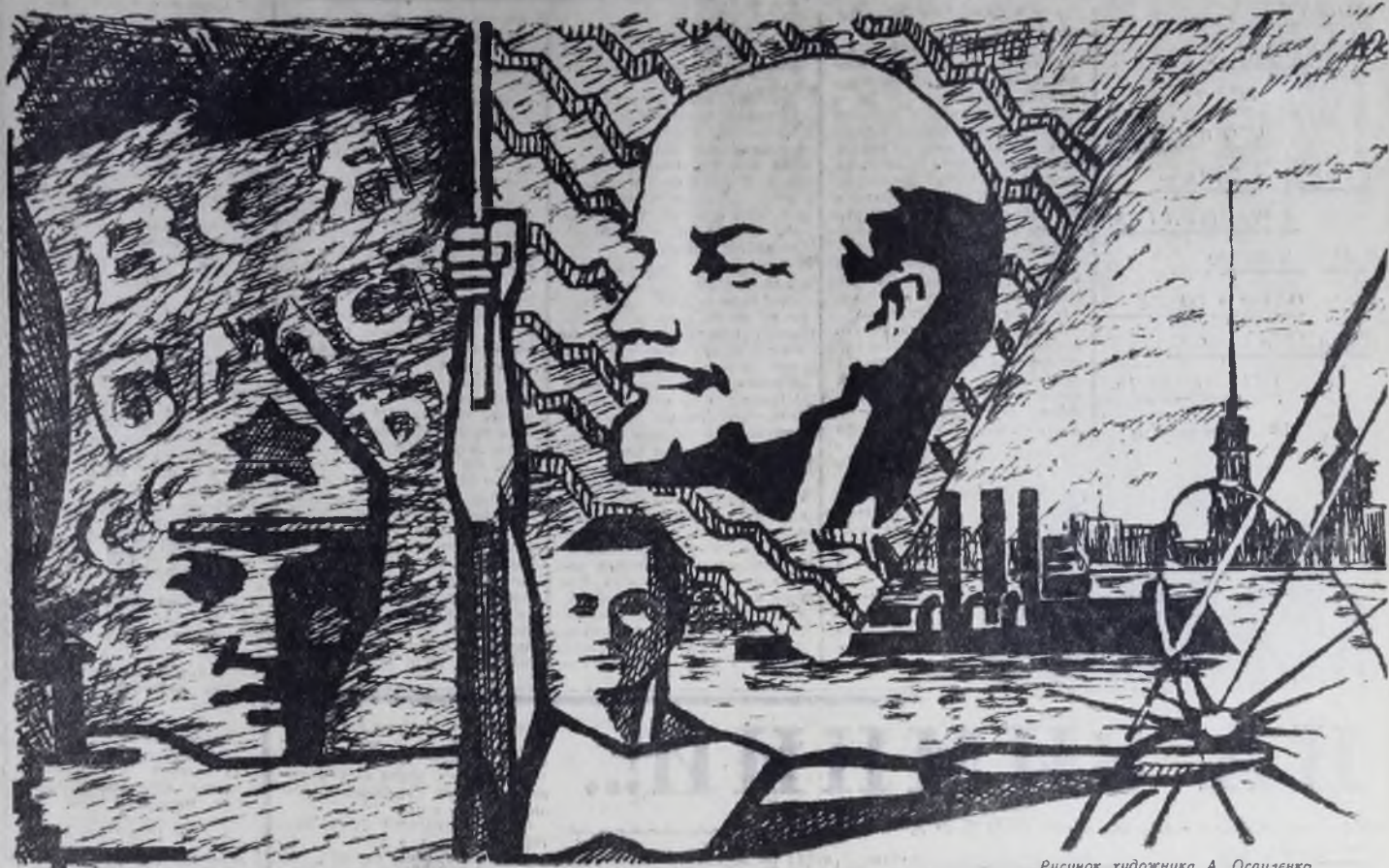
Рисунок художника А. Осаулenco.