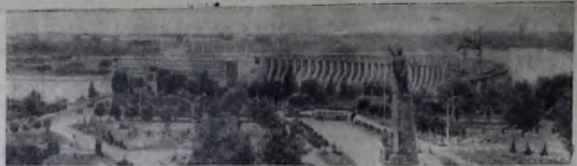
Вид на Днепровскую гидроэлектростанцию имени В. И. Ленина в Запорожье.

Зима уже совсем не за горами. Чтобы она не помешала нормальной деятельности двух ангарских промышленных гигантов, строители, монтажники обязаны ускорить завершение всех намеченных по подготовке к зиме работ. А. КРИВОЙ.