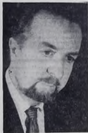
—естественно и закономерно, то Шпехт оказался в одном из них.

И когда родилась новая форма творчества — Народные театры,