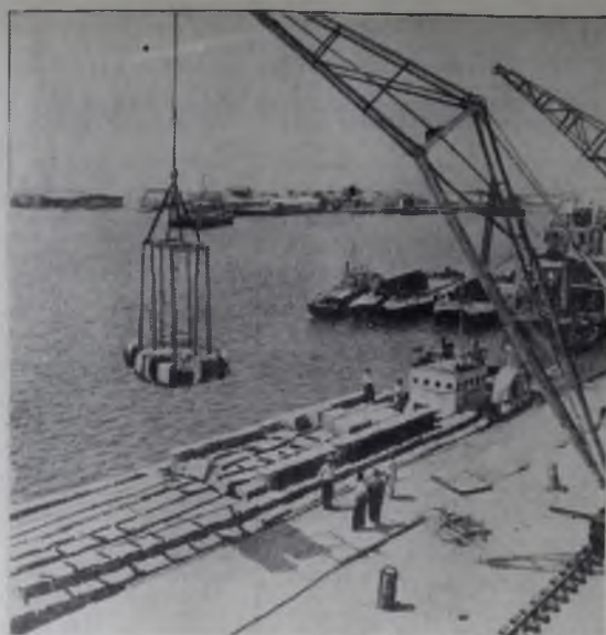
По Аму-Дарье и Аральскому морю идут караваны барж, грузные хлопковым волокном. В аральском порту дары Узбекистана и Туркмении перегружаются в железнодорожные вагоны. Отсюда поезд повезет хлопок дальше, на север, на текстильные предприятия Москвы, Ленинграда, Иваново. На снимке: разгрузка хлопкового волокна в порту.

Ангарская городская типография областного управления по печати Зак. 5639. Тираж 22 310